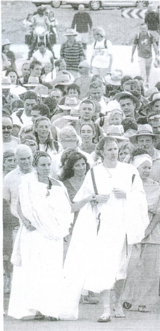
Imagen de archivo de una edición anterior de la ruta.

El número de inscritos ha descendido un 10% respecto a 2009 pero aumenta la cifra de los senderistas que hacen el recorrido completo