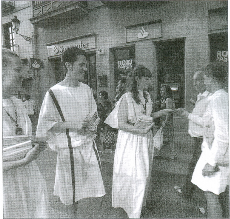
Las calles de la ciudad se llenaron ayer de actores que promocionaron Numantóbriga.

Por ello, se ha decidido retrasar la fecha de apertura hasta el pró-