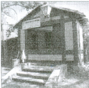
Biblioteca del Parque de la Dehesa.

La encargada de la biblioteca de Santa Bárbara también informó sobre el procedimiento de préstamo de los ejemplares. Para obtenerlos no es necesario ningún tipo de carnet, simplemente basta con rellenar un formulario con datos básicos como nombre y apellidos, DNI, dirección y un teléfono. Los libros o periódicos deben ser devueltos antes del cierre de la biblioteca.