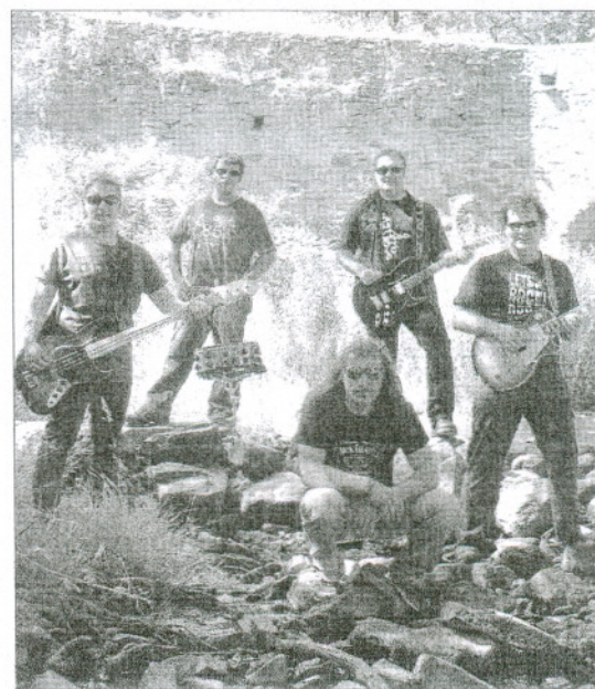
Foto de familia de 'The Jaus'.

uno de sus conciertos más entrañables, celebrado el año pasado durante las fiestas de Dévanos. El grupo recaló en este municipio ya que uno de los tres miembros de la banda procede de allí. Llegarán a Ágreda con su primer disco bajo el brazo y el premio del Certamen Nacional de Pop - Rock Interpeñas que les ha servido para poder grabar su segundo trabajo en unos meses. El estilo rockero del grupo sintoniza con los gustos musicales de la gente de la comarca. También después de este concierto se celebrará una nueva sesión de verbena, esta vez a cargo de la orquesta 'Ave Gades'. Ya el domingo la música seguirá siendo la protagonista ya que la discoteca 'Destello Móvil', amenizará desde por la mañana la tradicional comida del pollo que tendrá lugar en la Dehesa del municipio.