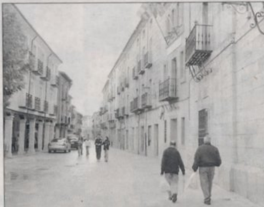
Vista de una de las calles del casco urbano de El Burgo de Osma.

El Centro de Integración de El Burgo permitirá el aprendizaje del