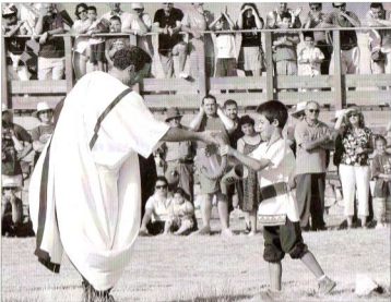
los numantinos recibieron a los ciudadanos de Augustóbriga tras una larga marcha.