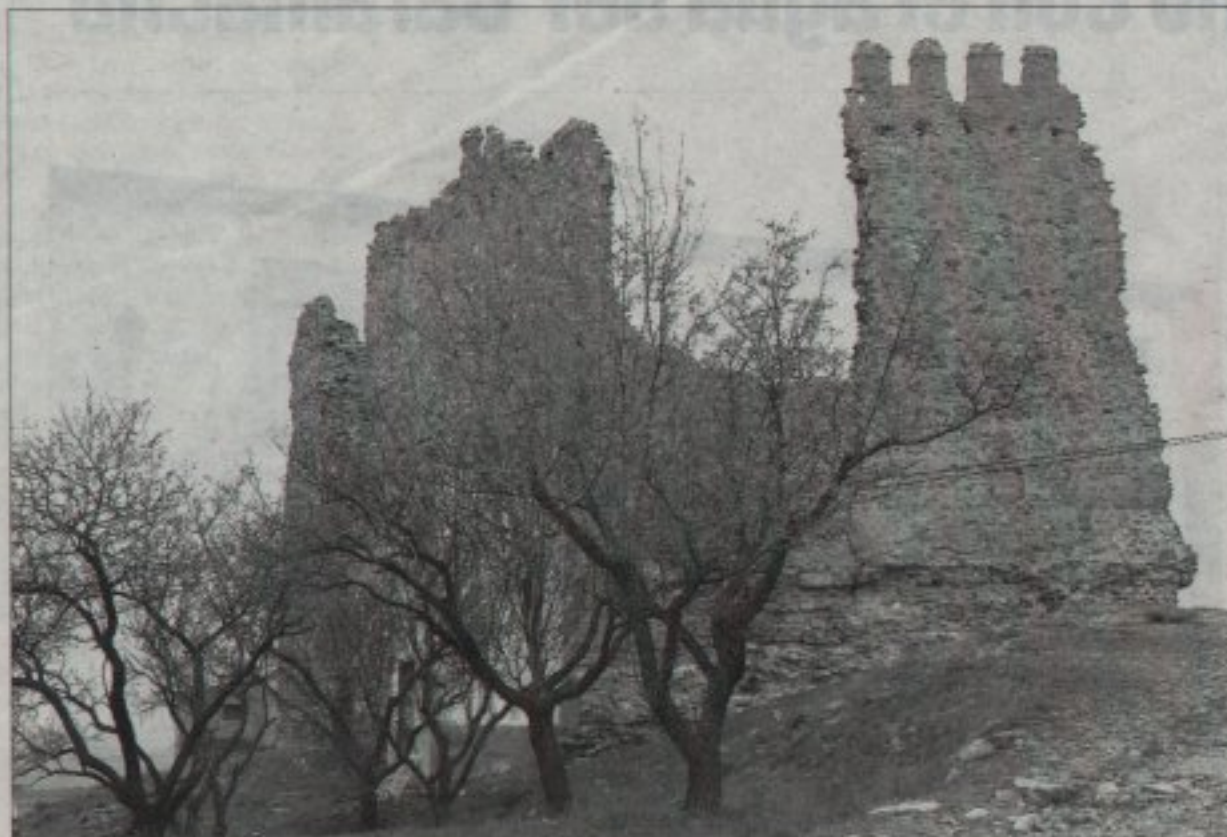
En la imagen, el castillo de Muro, cuyos restos están en peligro de desplome. / D. S.

Junto con el mantenimiento del castillo, la agrupación propone la mejora del entorno. Al respecto, el portavoz reseña que «la zona es un mirador excepcional del Moncayo y la comarca» e insiste en que «sería